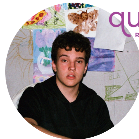
Тимофей Валов Разработка сайта